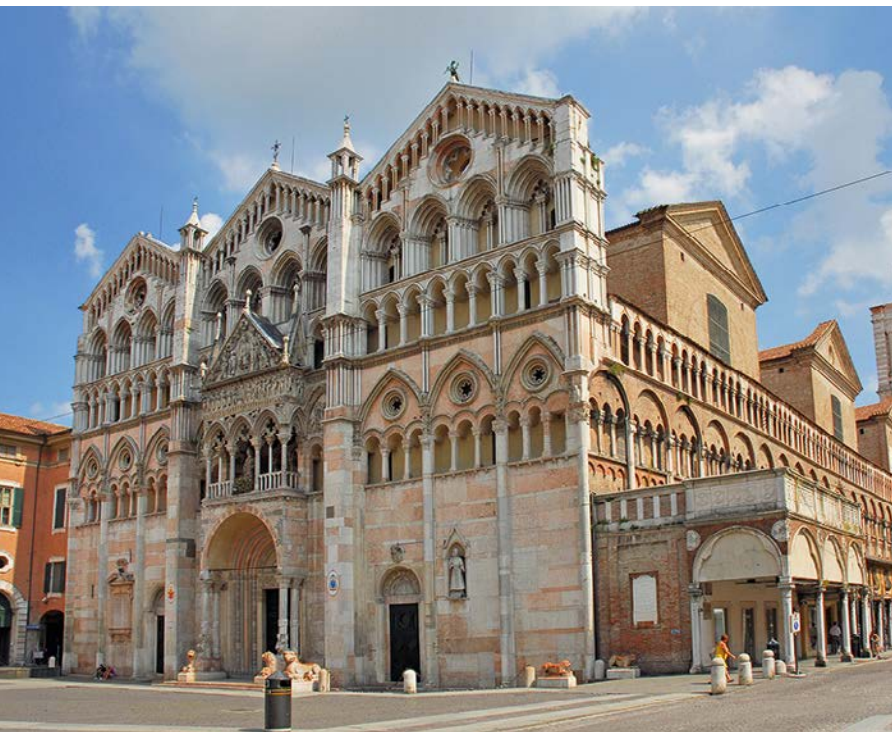
▲ Katedra San Giorgio Martire

Piazza Trento e Trieste. Jej długość wynosi 118 m (dla porównania katedra w Parmie ma 81 m, a ta w Modenie – 67 m). Szerokość fasady głównej to prawie 41 m (w Parmie – 28 m i 24 m w Modenie). Jest więc budowlą ogromną, jedną z większych w Emilii-Romanii, a rozmiarami przebija ją jedynie bazylika św. Petroniusza w Bolonii.