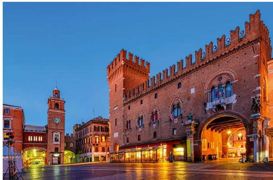
▲ Palazzo Municipale

Pod koniec XV w. ulubiony architekt d'Estów, Biagio Rossetti, okrył ją renesansową szatą, ale część dekoracji uległa zniszczeniu w czasie trzęsienia ziemi w 1570 r. Po rekonstrukcji zyskała swój obecny wygląd. Ma trójnawowe wnętrze na planie krzyża łacińskiego z dwoma rzędami kaplic bocznych, po osiem z każdej strony. Przez kolejne wieki było ozdabiane dziełami sztuki miejscowych twórców, które dziś w większości są zastąpione kopiami, a oryginały znajdują się w tutejszej Pinakotece. Ponadto pochowano tu pięciu członków rodu d'Este. Świątynia znacznie ucierpiła w czasie trzęsienia ziemi w 2012 r.