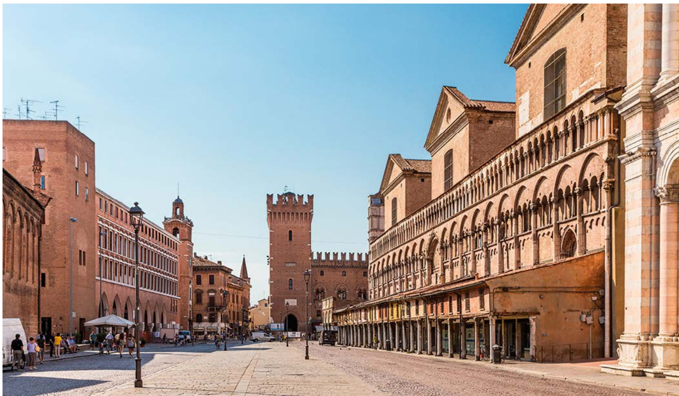
▲ Ferrara, Piazza Trento e Trieste

Dzięki dogodnemu położeniu w żyznej delcie Padu pierwsi osadnicy pojawili się tu w zamierzchłych, prehistorycznych czasach. Rzymianie założyli tutaj swoją kolonię Forum Alieni, natomiast w połowie VIII w. jej nazwa pojawia się w dokumencie longobardzkiego króla Dezyderiusza jako miasto należące do Egzarchatu Rawenny , ostatniego przysiółka Bizancjum na terenie Włoch. W 757 r. obszar ten został włączony w granice Państwa Kościelnego .